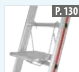
Taquet pose-pieds universel pliant