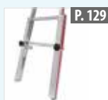
Kit de béquilles de rallonge