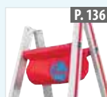
Trousse à outils pour échelles en aluminium