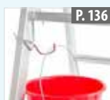
Crochet pour seau pour échelles à échelons